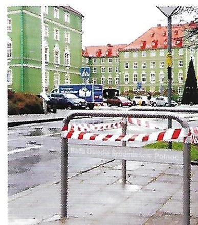
XI 2017 – montaż ok. 60 stojaków rowerowych przy szkołach, boiskach i sklepach, wartość inwestycji 20 tys. zł