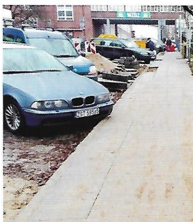
XI 2017 – remont chodnika przy pl. Kilińskiego, wartość inwestycji 140 tys. zł