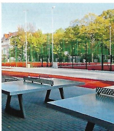
VI 2018 – budowa kompleksu boisk przy Szkole Podstawowej nr 46 z inicjatywy Rady Osiedla, wartość inwestycji 2,8 mln zł