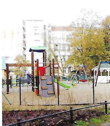
IX 2017 – budowa placu zabaw, kwartał ul. Monte Cassino, Felczaka, Niedziałkowskiego, Jana Pawła II, wartość inwestycji 143 tys. zł