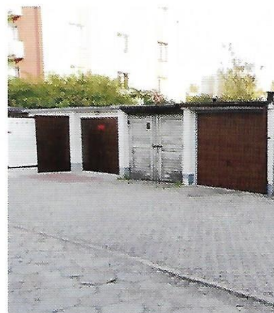
VII 2018 – remont drogi dojazdowej do garaży pomiędzy ul. Felczaka a Niedziałkowskiego, wartość inwestycji 84 tys. zł