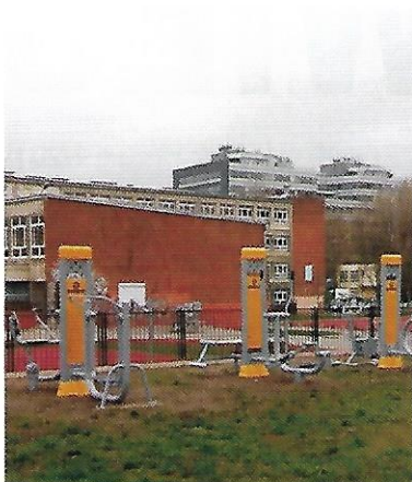
XII 2018 – budowa siłowni pod chmurką wzdłuż ogrodzenia Szkoły Podstawowej nr 56, wartość inwestycji 76 tys. zł