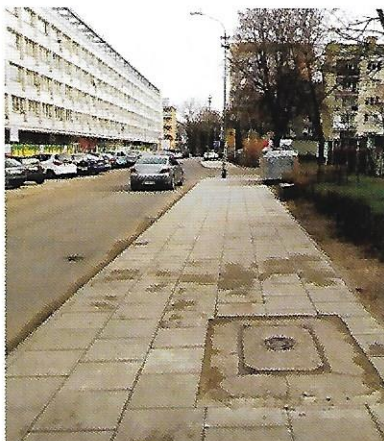
XI 2018 – budowa chodnika przy ul. Odzieżowej, wartość inwestycji 100 tys. zł