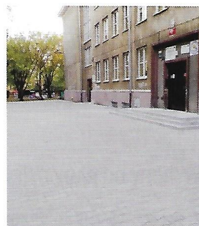
IX 2016 – budowa placu apelowego przed Szkołą Podstawową nr 46, wartość inwestycji 143 tys. zł