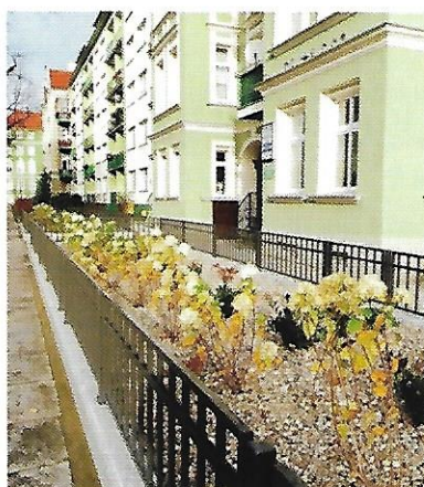
X 2017 - rewitalizacja ogródków w al. Papieża Jana Pawła II, wartość inwestycji 100 tys. zł