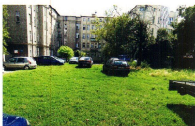
Plac w kwartale ulic Monte Cassino/Felczaka/ Niedziałkowskiego/Papieża Jana Pawła II