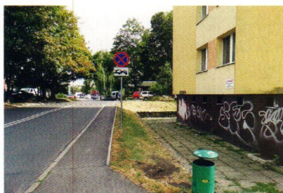
Chodnik od ul. Unisławy do pl. Witosa

Rada Osiedla Śródmieście Północ na inwestycje w 2015 r. otrzymała 150 tys. zł.