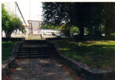
Schody i chodniki przy Gimnazjum nr 21 ul. Mickiewicza