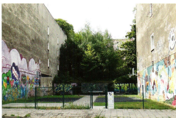
Plac rekreacyjny przy al. Wyzwolenia 77/79